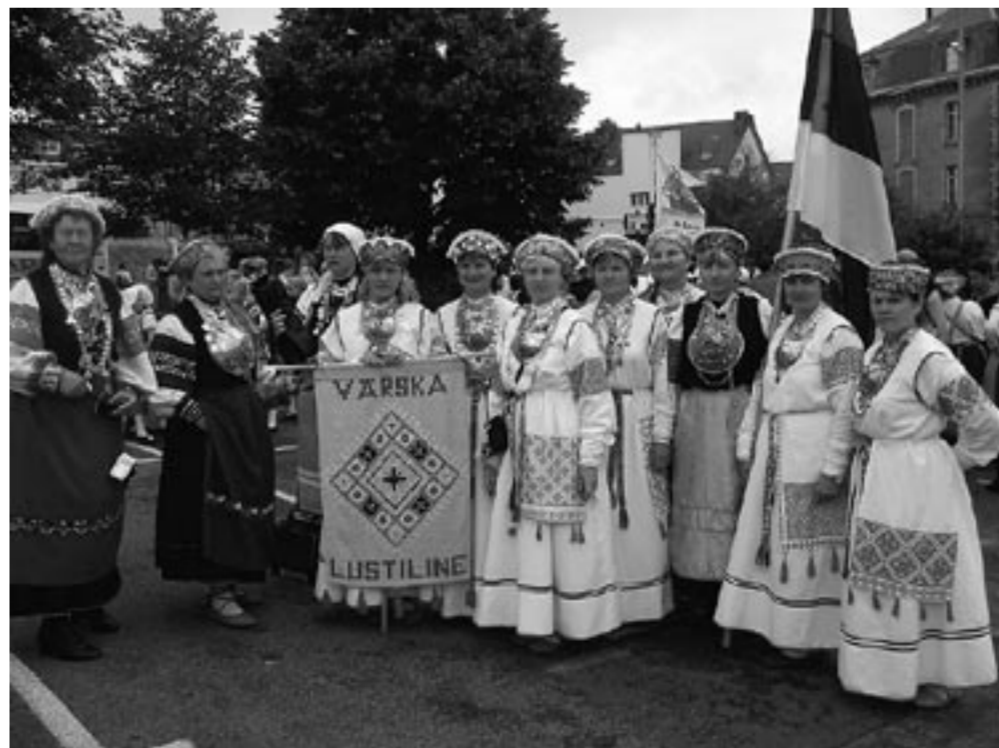
Lustilise liikmed enne rongkäiku

Galina Viskariga 42. Europeade folkloorifestivalil Prantsusmaal, Quimperis linnas. Kokku reisid Eestist Prantsusmaale üle 200 taidleja, 5 bussitait tantsijaid ja pillimehi. Meie kahekordse