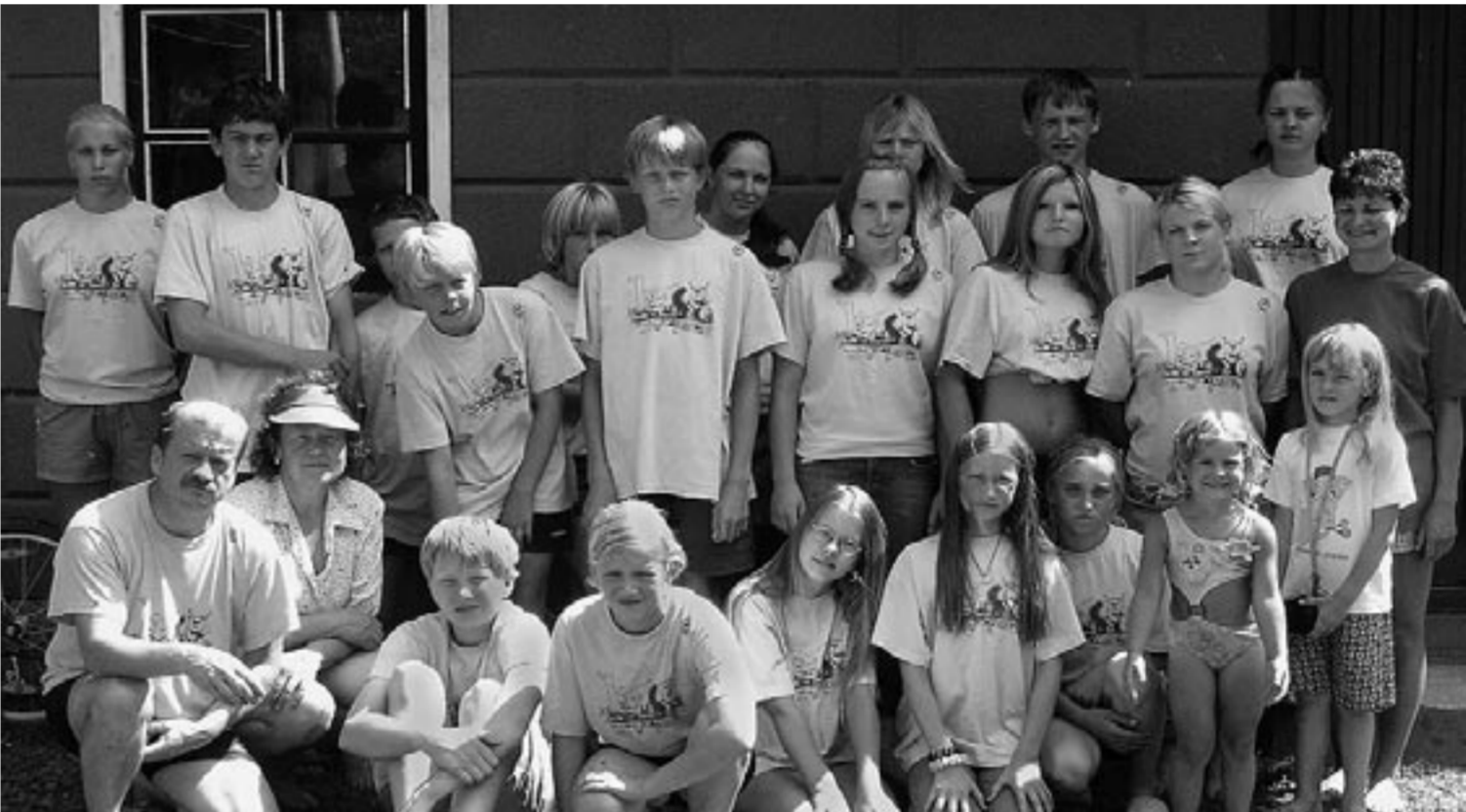
„Kodomaask“ rühma liikmed