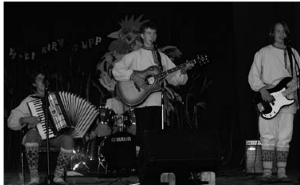
„Zeto” poisid oma esimese tsõõriklpaadi esitlusest