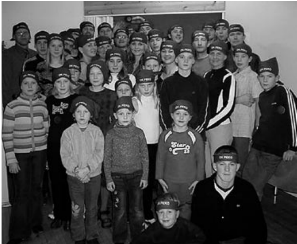
OK PEKO liikmed 2003 aasta lõpetamisel

•Meie klubi liikmete headest tulemustest teistel aladel võiks esile tuua multisporti etappidel häid kohti saavutanud naistevõistkond, kuhu kuu-