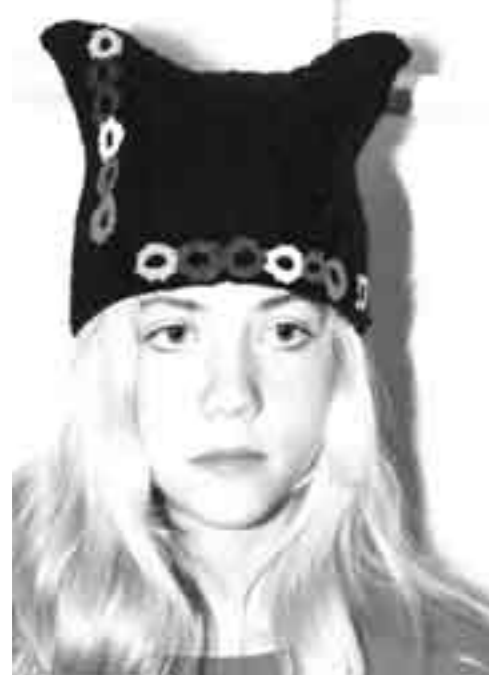
2004. aasta Seto pitsipäevade võistlustöö.

Kaheteistkümnendad seto pitsipäevad toimuvad Seto Talumuuseumis traditsioonilisel ajal 5.–15. mai. Tänavuseks teemaks sai välja hõigatud "Kingitus", kuna kohalike suveniiridega on nagu on ja neid võiks juurde teha.