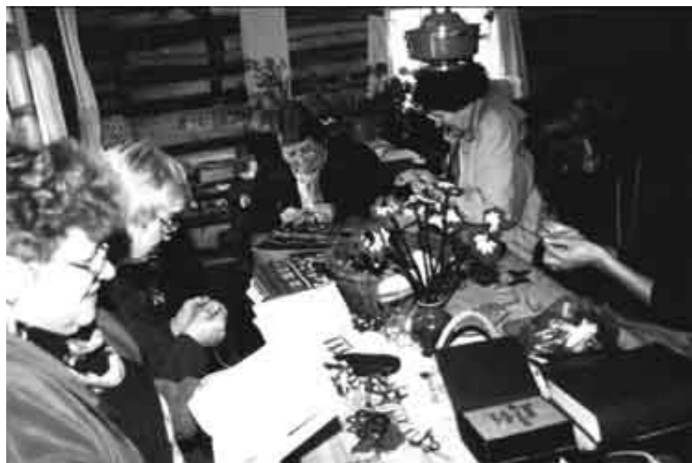
Seto pitsi õppimas.

Ühe talu käsitöönäitus tuleb sel aastal Rāpinast, kuid seto perest. Loomulikult saab näha vana värvilist pitsi ja seda õppida nagu traditsiooniliselt ikka.