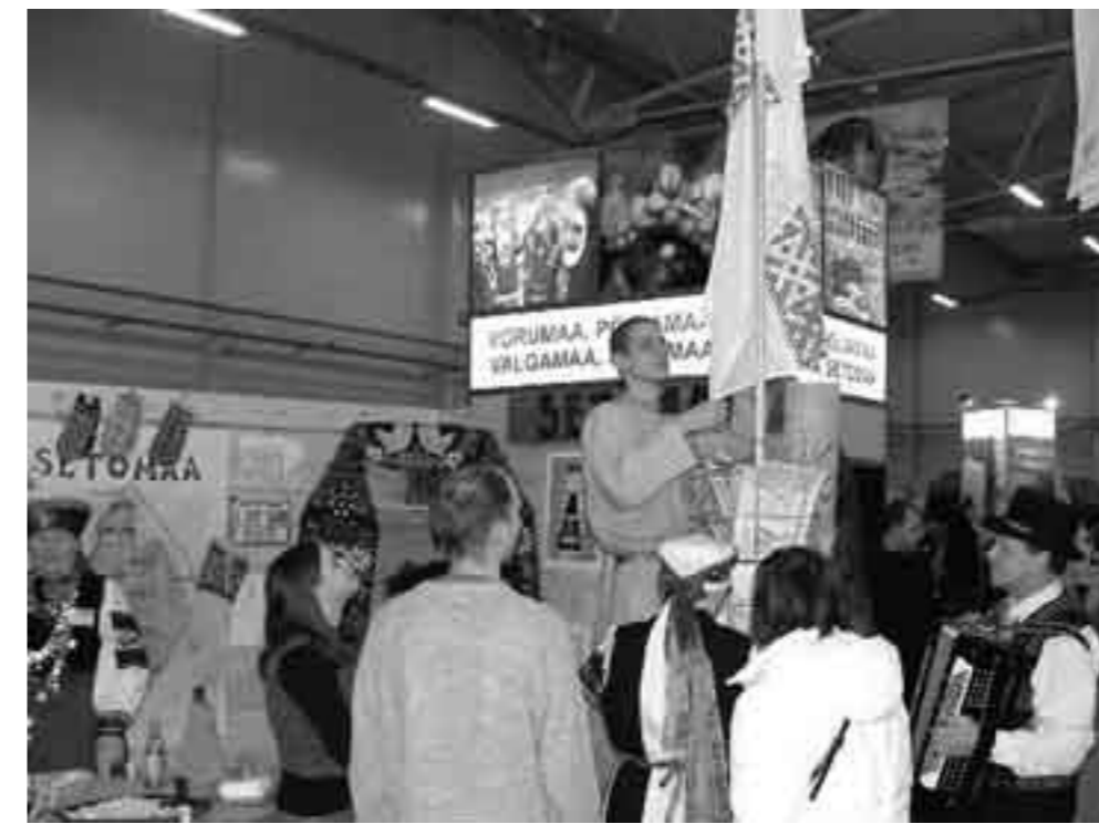
Setomaa lipp messil.