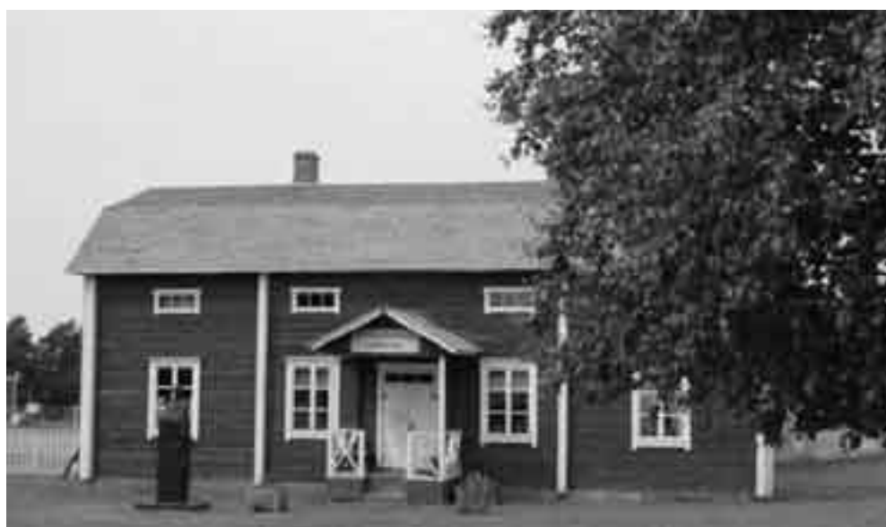
Esimene Soome president Kaarlo Juho Ståhlberg (osales ka 1920 Tartu rahu sõlmimisel) veetis oma lapsepõlve Haapajärvil. Temale pühendatud muuseum asub Haapajärvi kesklinnas.

Linnanõukogus on kolm peamist komisjoni: sotsiaal- ja tervishoiukomisjon; haridus- ja kultuurikomisjon; majanduskomisjon. Kõikides komisjonides on üheksa liiget.