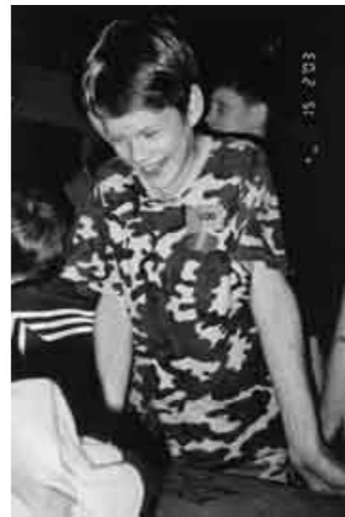
Sõbrapäevapeol www.rate.ee hääletuse põhjal enim punkte saanud foto.

kõigil oli võimalus anda punkte ja kommentaare viimaste aastate sõbrapäevapidudel tehtud fotosid. Enim punkte saanud foto lubati avaldada valla lehes (vt foto ülal paremal). Peo külalstajatele pakkus maiustusi õpilasfirma "Elf".