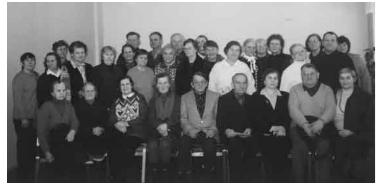
Pensionäride selts külas Värskas Gümnaasiumil.