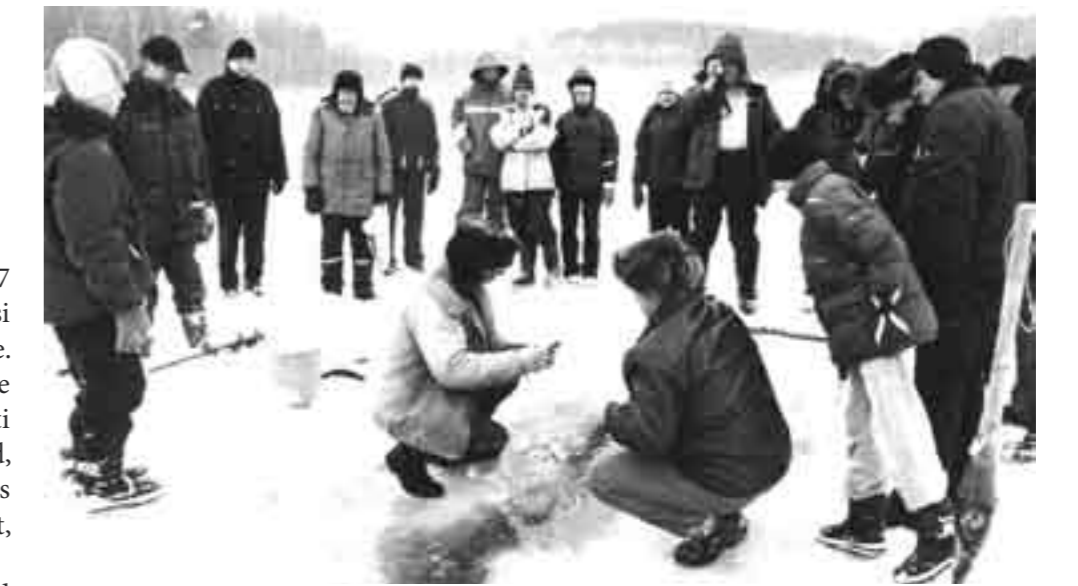
Hetk jääaluse püügi demonstratsioonil Örsava järvel 2003. aastal.